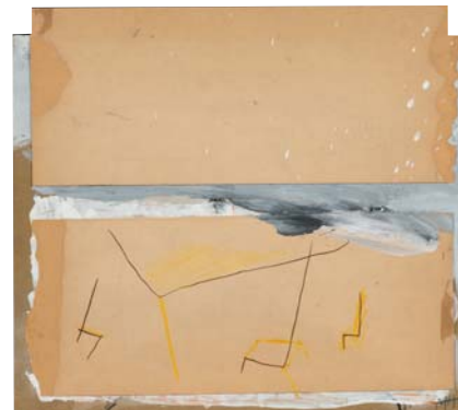
Manel Lledós, Teatros #6 , 1981. Acrílico e lapis sobre cartón (51 x 56 cm).

obras realizadas neses anos xunto ás súas últimas pinturas e esculturas. A elección da illa de Manhattan como destino do seu periplo vital e mental, explícase no desexo de buscar estímulos, aspirando a integrarse na súa diferenza, seducidos pola toma de contacto coa idea de modernidade, que esta cidade viña ofrecendo desde os anos vinte e, xa definitivamente, desde o fin da II Guerra Mundial. Nela, estes artistas iniciaron un excéntrico encontro, compartindo a vida nun mesmo apartamento e estudo no Lower East Side, que foi o epicentro do seu breve tempo xuntos na cidade dos rañaceos —Lledós e Saco lograron incorporarse ao complexo sistema americano, mentres a memoria comprometida