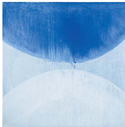
Ánxel Huete, Melancolía 2 , 2016. Acrílico sobre lenzo (150 x 150cm).

obras realizadas neses anos xunto ás súas últimas pinturas e esculturas. A elección da illa de Manhattan como destino do seu periplo vital e mental, explícase no desexo de buscar estímulos, aspirando a integrarse na súa diferenza, seducidos pola toma de contacto coa idea de modernidade, que esta cidade viña ofrecendo desde os anos vinte e, xa definitivamente, desde o fin da II Guerra Mundial. Nela, estes artistas iniciaron un excéntrico encontro, compartindo a vida nun mesmo apartamento e estudo no Lower East Side, que foi o epicentro do seu breve tempo xuntos na cidade dos rañaceos —Lledós e Saco lograron incorporarse ao complexo sistema americano, mentres a memoria comprometida