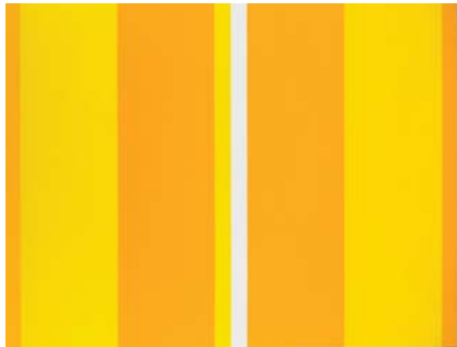
Manel Lledós, Pasajes #3 , 2015. Óleo e lapis sobre tea (162,5 x 213cm).

Trátase dunha aproximación vital e artística que, nas súas posibles perspectivas de interpretación, tamén suxire necesarias apreciacións acerca do concepto “diáspora cultural”, que se inclúe nos procesos migratorios como un máis e que se ben estes dan resposta a posibles problemas económicos que, desde os lugares de orixe, animan as persoas a abandonar os seus fogares e tentar probar sorte noutros espazos, aquel tipo de mobilidade non atende precisamente a estas circunstancias. Podemos falar entón, doutras motivacións que dan pé a esta “emigración especial”, como os relacionados co desexo de vivir noutro lugar, que no caso dos artistas contemporáneos ten que ver coa vontade de pór en marcha unha viaxe, esencialmente interior, cara a continxencia; á expectativa,