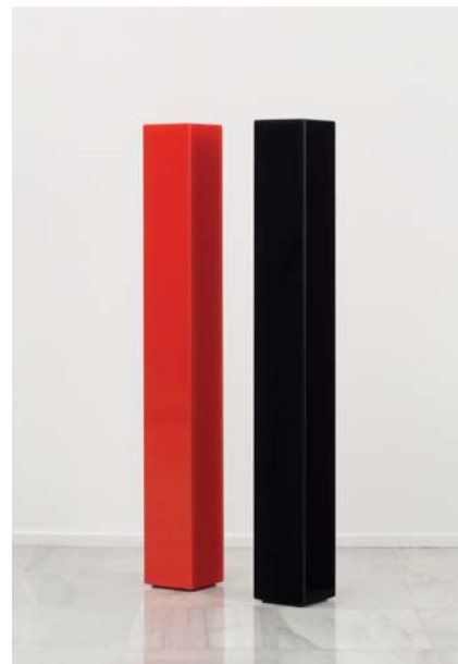
Miguel Saco, S/T , 2014. Madeira lacada (124,5 x 18 x 18cm).

A presente exposición, desde o lugar privilexiado do reencontro, mostra a forza innata do que novamente comeza. Un diálogo a tres voces fundamentado en traballos recentes, algúns deles realizados ex profeso para a mostra, xunto a outros pertencentes ao período 1981-1982. Obras que, a pesar de actuar coma ecos dun afastado momento, converten o percorrido nunha nova travesía de espazos cargados de realidade, dando lugar a un novo encontro que active un novo tempo.