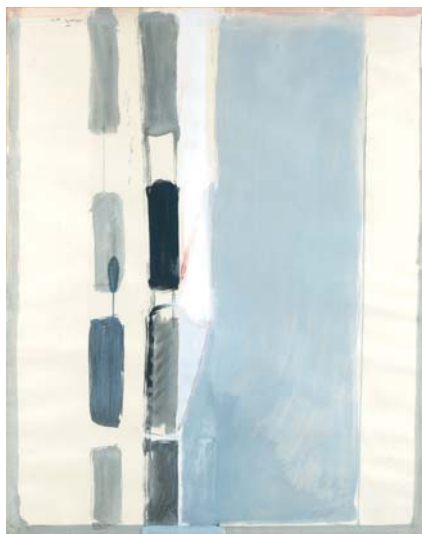
Ánxel Huete, S/T , 1981. Pintura sobre papel (152 x 121 cm).

Esta exposición aborda a acción artística desde a experiencia dun lugar. Un espazo de tempo concreto, fixado e cargado de intencións: Nova York a comezos dos anos oitenta; desexado, imaxinado e vivido polos artistas Ánxel Huete (Ourense, 1944), Manel Lledós (Barcelona, 1955) e Miguel Saco (Ourense, 1956). Un encontro compartido que agora se revisa na procura de reactivalo, a través das