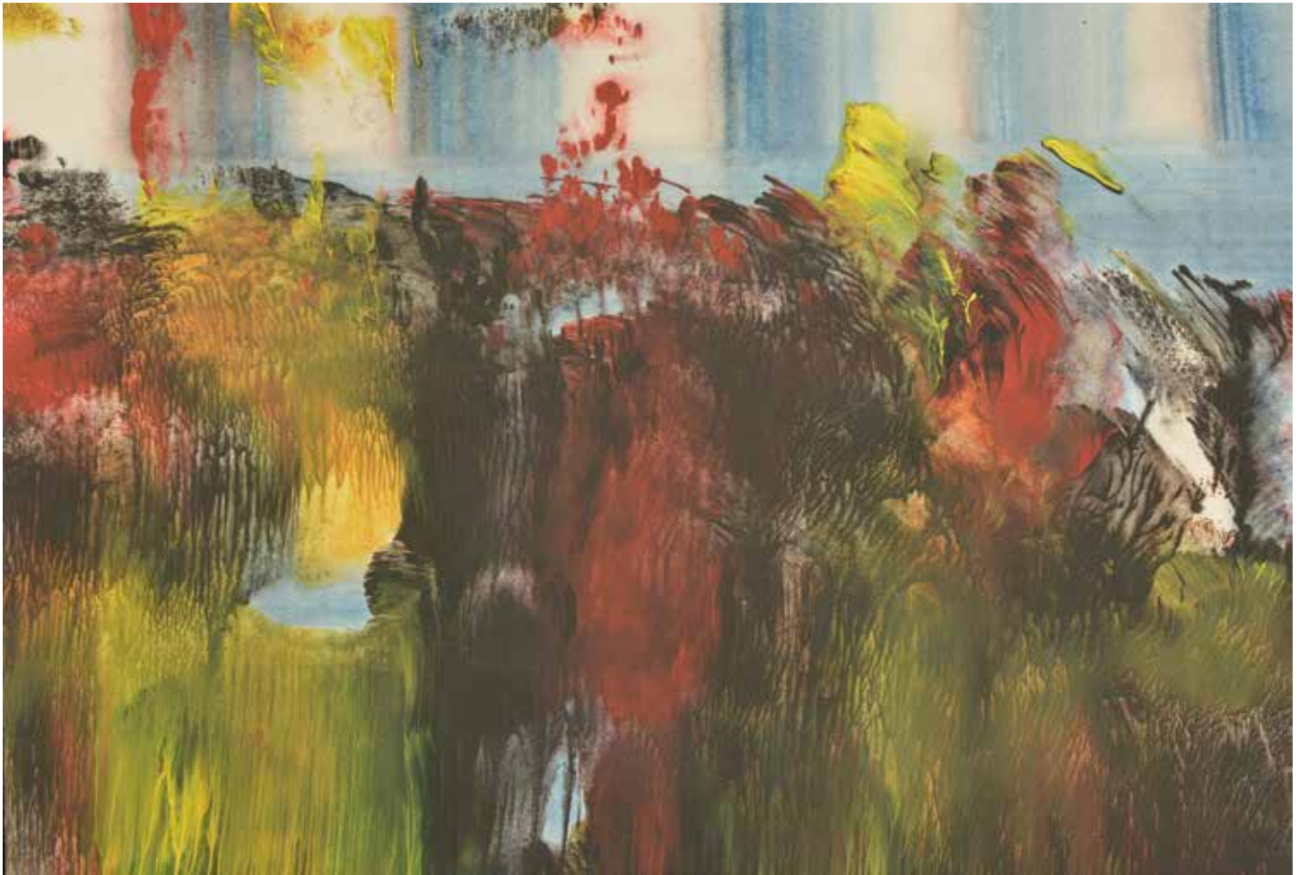
Climax Acrílico / papel 45x52 cm 2017