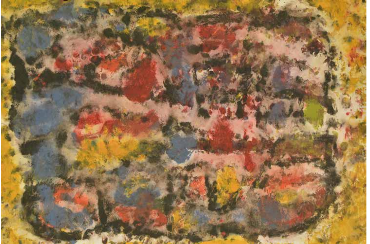
Sen título Acrílico / papel 66x96 cm 2018